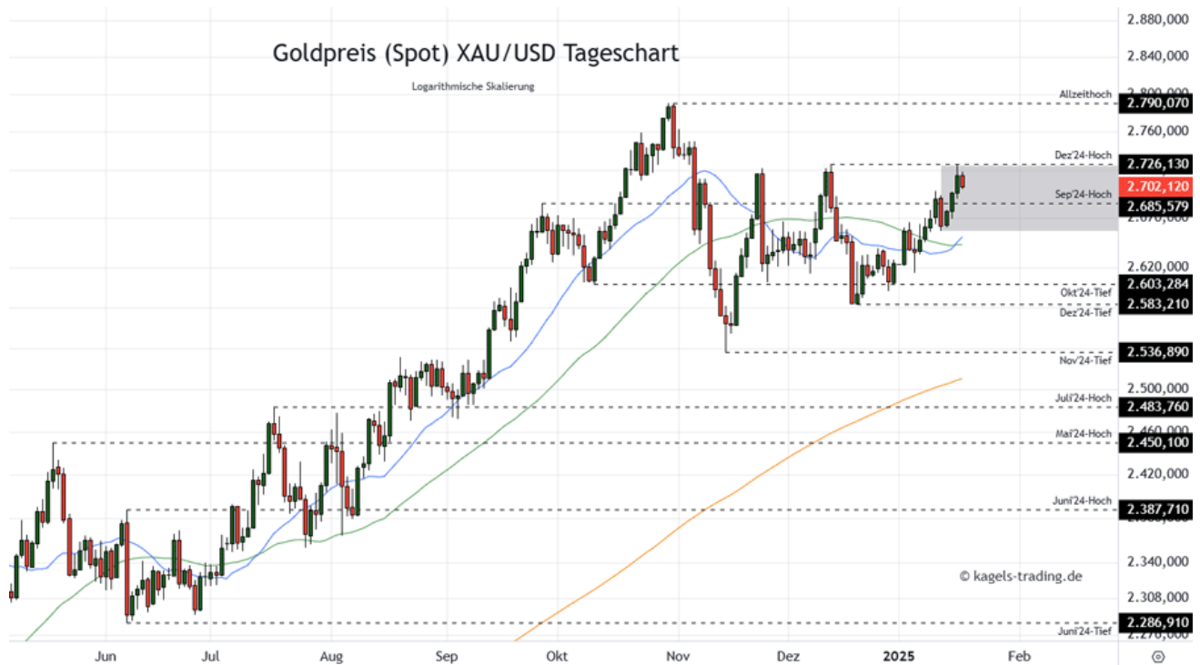
Goldpreis Prognose Tageschart - diese & nächste Woche

&#149; Mögliche Wochenspanne: 2740 $ bis 2.830 $