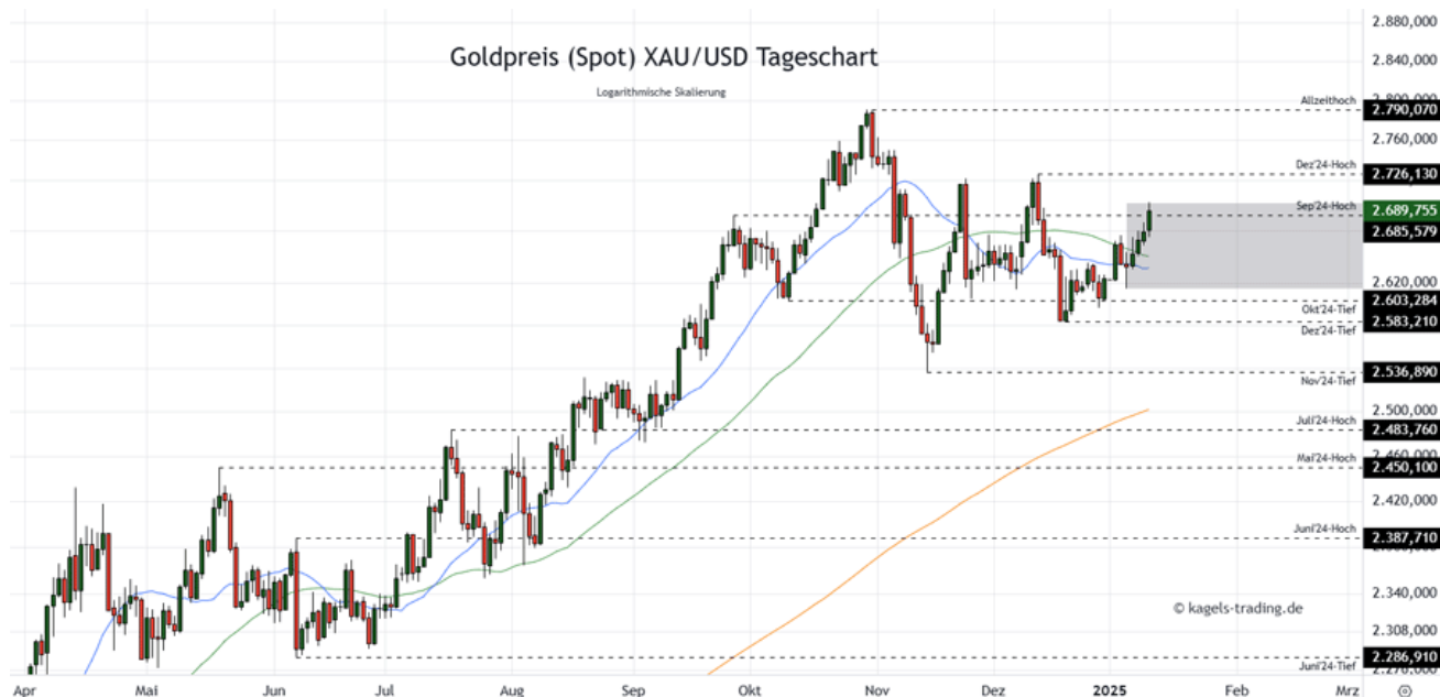
Goldpreis Prognose Tageschart - diese & nächste Woche (Chart: TradingView )

&#149; Mögliche Wochenspanne: 2690 $ bis 2.790 $