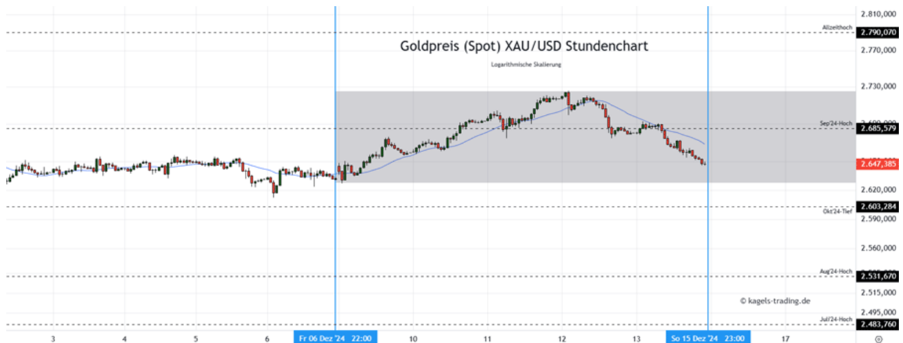
Goldpreis Prognose: Kurs im Stundenchart

In der vergangenen Woche konnte sich der Goldpreis zunächst über 2.700 $ erholen, ist im weiteren Verlauf jedoch wieder deutlich zurückgekommen. Damit dürfte zum Wochenstart am Montag das Vorwochentief im Fokus liegen, erst eine Rückkehr über das Septemberhoch würde wieder eine positive Tendenz signalisieren.