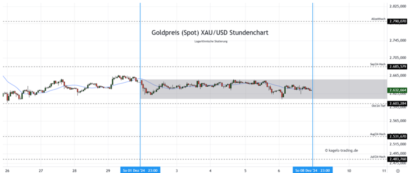
Goldpreis Prognose: Kurs im Stundenchart

In der vergangenen Woche hat der Goldpreis keine deutlichen Impulse gezeigt und eine flache Basis ausgebildet. Hier dürfte ein Ausbruch aus der Vorwochenspanne (grau) den nächsten Richtungsimpuls bilden, an dem sich der weitere Wochenverlauf orientieren würde. Ob bereits am Montag stärkere Bewegung in den Markt kommt, bleibt abzuwarten.