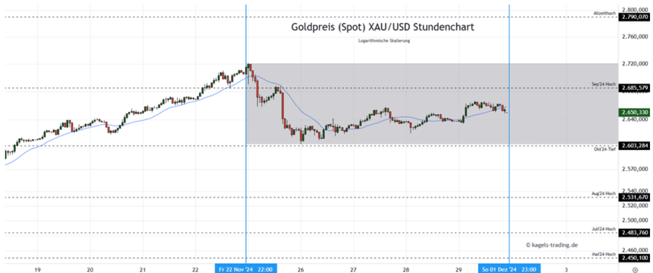
Goldpreis Prognose: Kurs im Stundenchart

In der vergangenen Woche hat der Goldpreis zuerst einen Korrekturimpuls gezeigt, sich im weiteren Verlauf am Oktobertief gestützt und eine leichte Erholung durchlaufen. Zum Wochenstart am Montag bleibt zunächst abzuwarten, ob das Polster zum Vorwochentief nach dem langen US-Feiertagswochenende weiter ausgebaut werden kann.