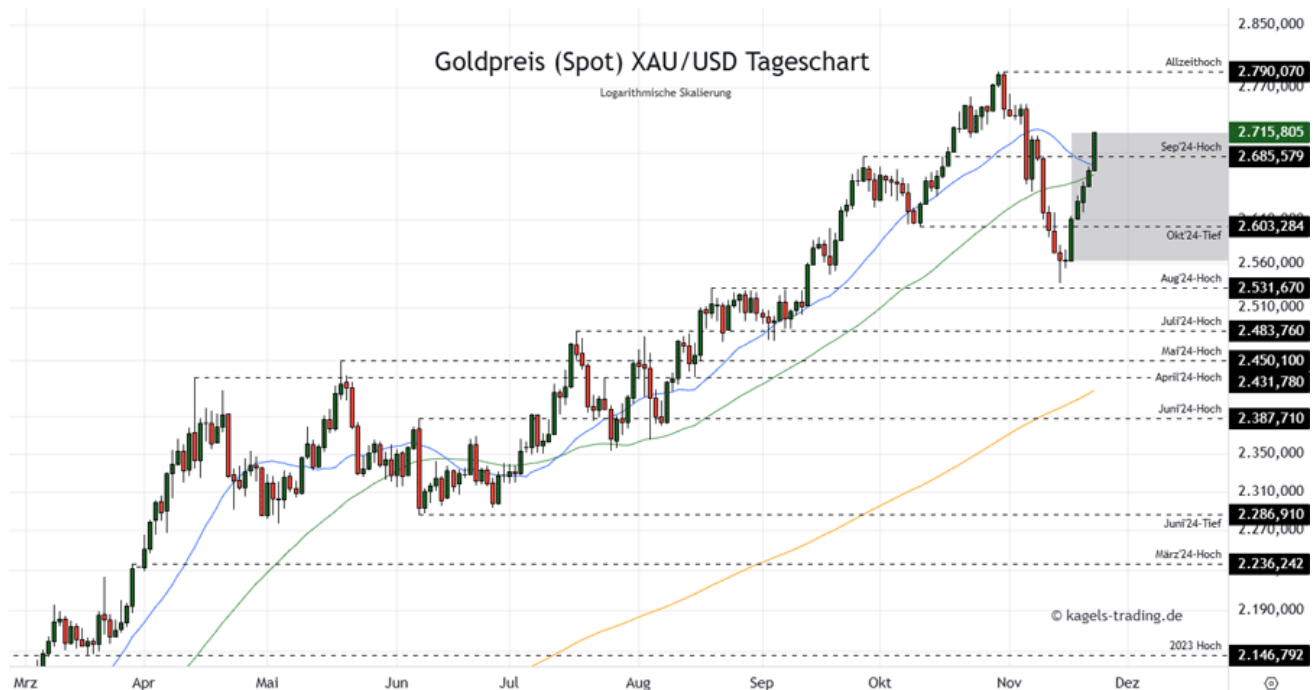
Goldpreis Prognose Tageschart - diese & nächste Woche (Chart: TradingView )

➤ Mögliche Wochenspanne: 2.700 $ bis 2.810 $ alternativ 2.740 $ bis 2.870 $