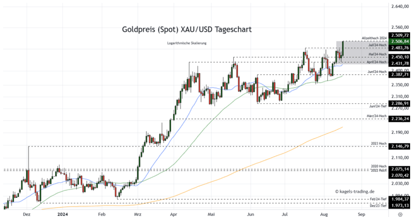
Goldpreis Prognose Tageschart – diese & nächste Woche (Chart: TradingView )

&#149; Mögliche Wochenspanne: 2.490 $ bis 2.600 $