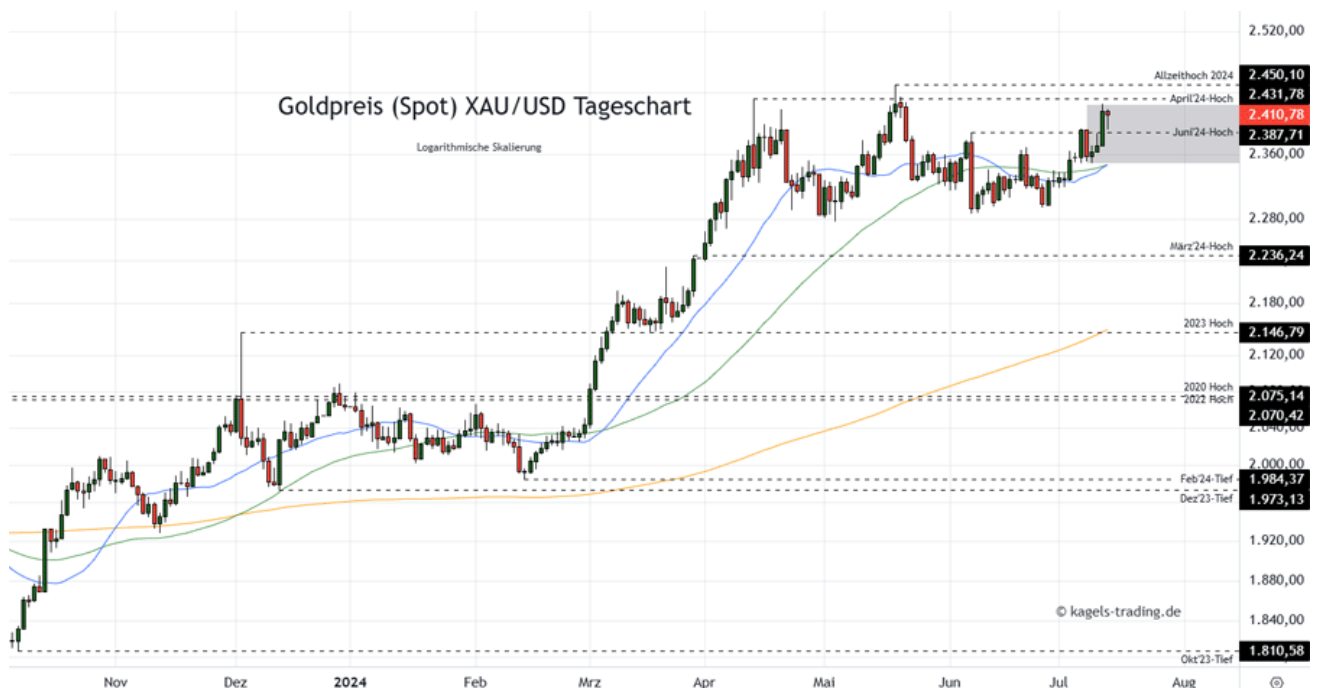
Goldpreis Prognose Tageschart – diese & nächste Woche (Chart: TradingView )

&#149; Mögliche Wochenspanne: 2.395 $ bis 2.470 $ alternativ 2.420 $ bis 2.510 $