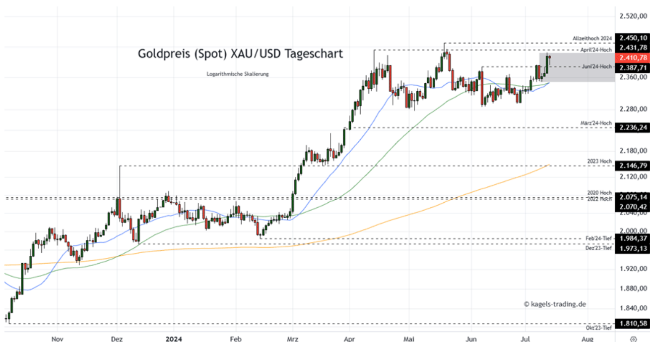
Goldpreis Prognose Tageschart – diese & nächste Woche (Chart: TradingView )

➤ Mögliche Wochenspanne: 2.395 $ bis 2.470 $ alternativ 2.420 $ bis 2.510 $