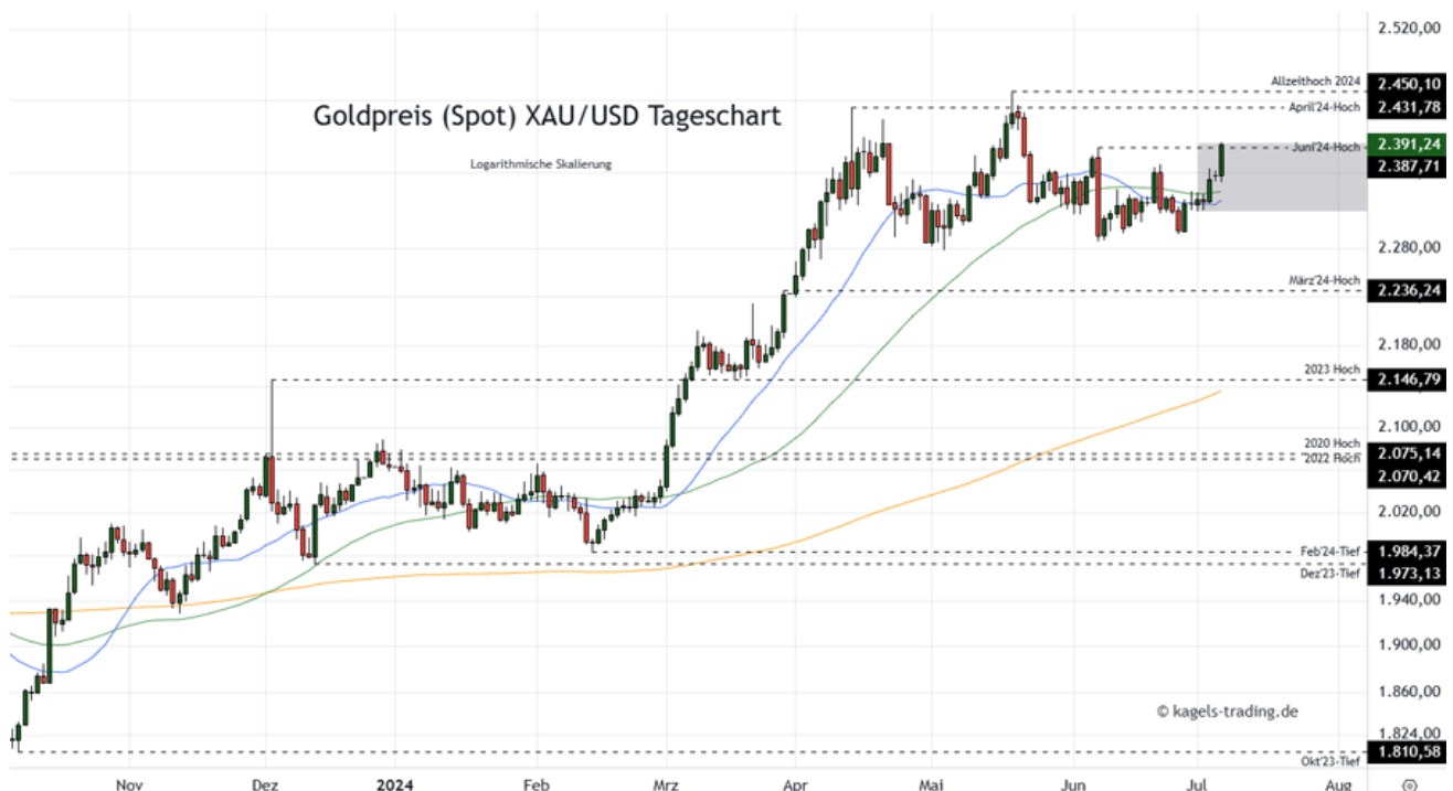
Goldpreis Prognose Tageschart – diese & nächste Woche (Chart: TradingView )

&#149; Mögliche Wochenspanne: 2.390 $ bis 2.480 $