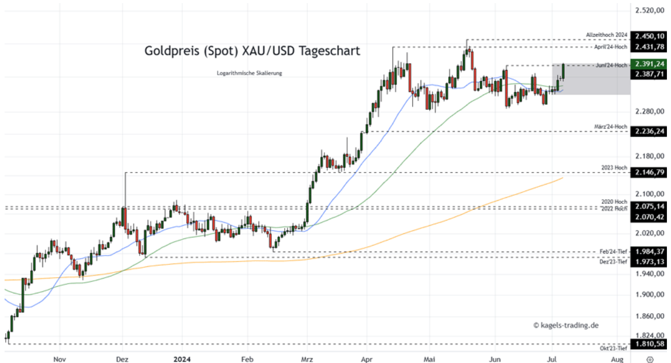
Goldpreis Prognose Tageschart – diese & nächste Woche (Chart: TradingView )

&#149; Mögliche Wochenspanne: 2.390 $ bis 2.480 $