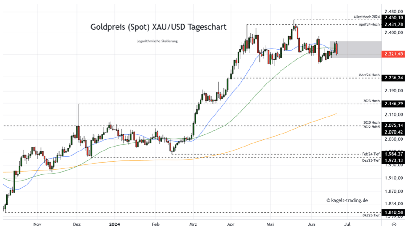
Goldpreis Prognose Tageschart – diese & nächste Woche (Chart: TradingView )

&#149; Mögliche Wochenspanne: 2.230 $ bis 2.310 $