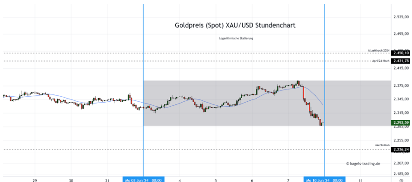
Goldpreis Prognose: Kurs im Stundenchart

Mögliche Tagesspanne: 2.250 $ bis 2.310 $