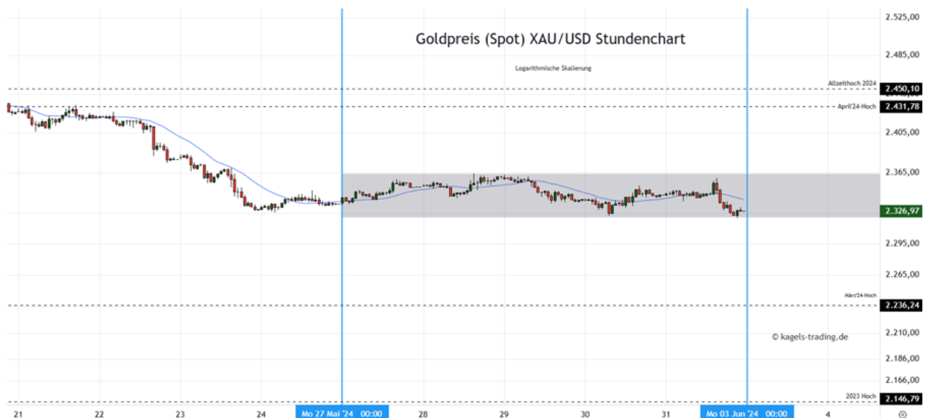
Goldpreis Prognose: Kurs im Stundenchart (Chart: TradingView )

&#149; Mögliche Tagesspanne: 2.305 $ bis 2.340 $