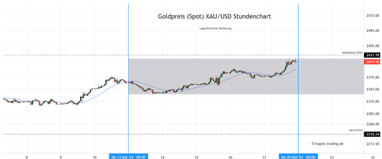
Goldpreis Prognose: Kurs im Stundenchart

&#149; Mögliche Tagesspanne: 2.405 $ bis 2.450 $