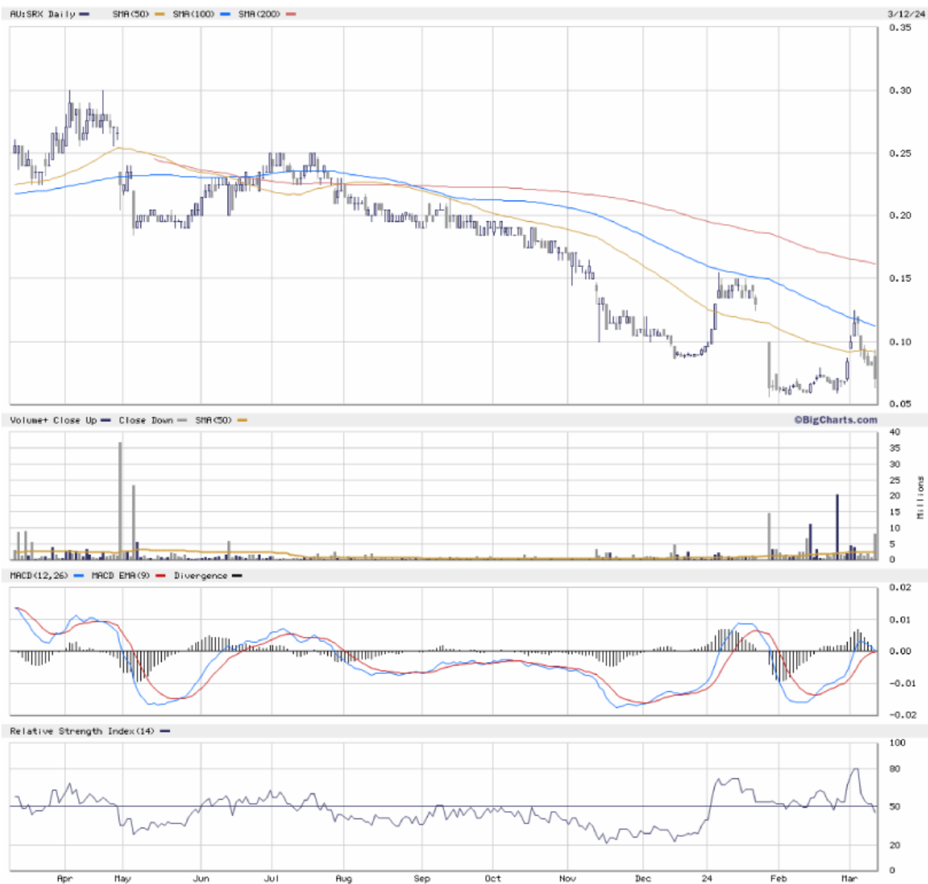
Chart Sovereign Metals: