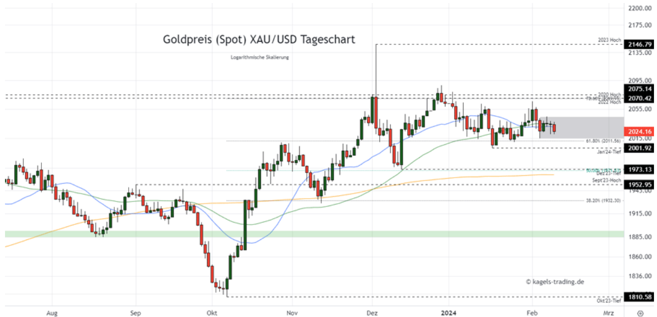
Goldpreis Prognose Tageschart – diese & nächste Woche

&#149; Mögliche Wochenspanne: 1.990 $ bis 2.040 $