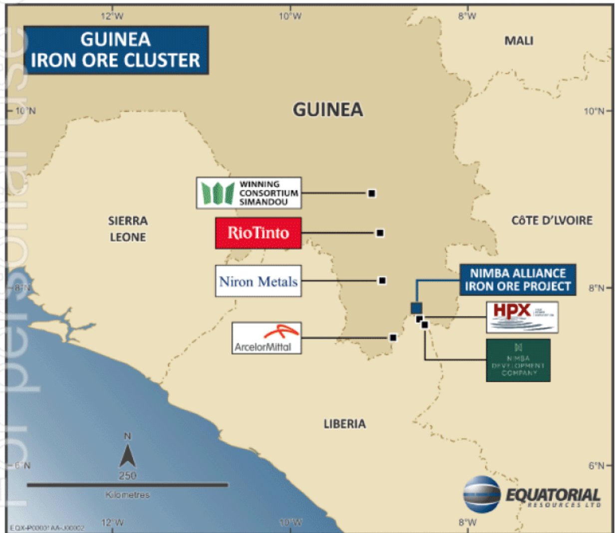
Figure 4 – Guinea Iron Ore Cluster

Ebenfalls in der Nähe, gleich hinter der Grenze in Liberia, befindet sich das Eisenerzprojekt Tokadeh, das dem indischen Unternehmen ArcelorMittal gehört.