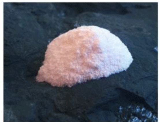
Figure 4. Element 25 HPMSM crystalline product.

Die finalen Testergebnisse werden Ende Oktober erwartet und dann direkt in die Machbarkeitsstudie einfließen.