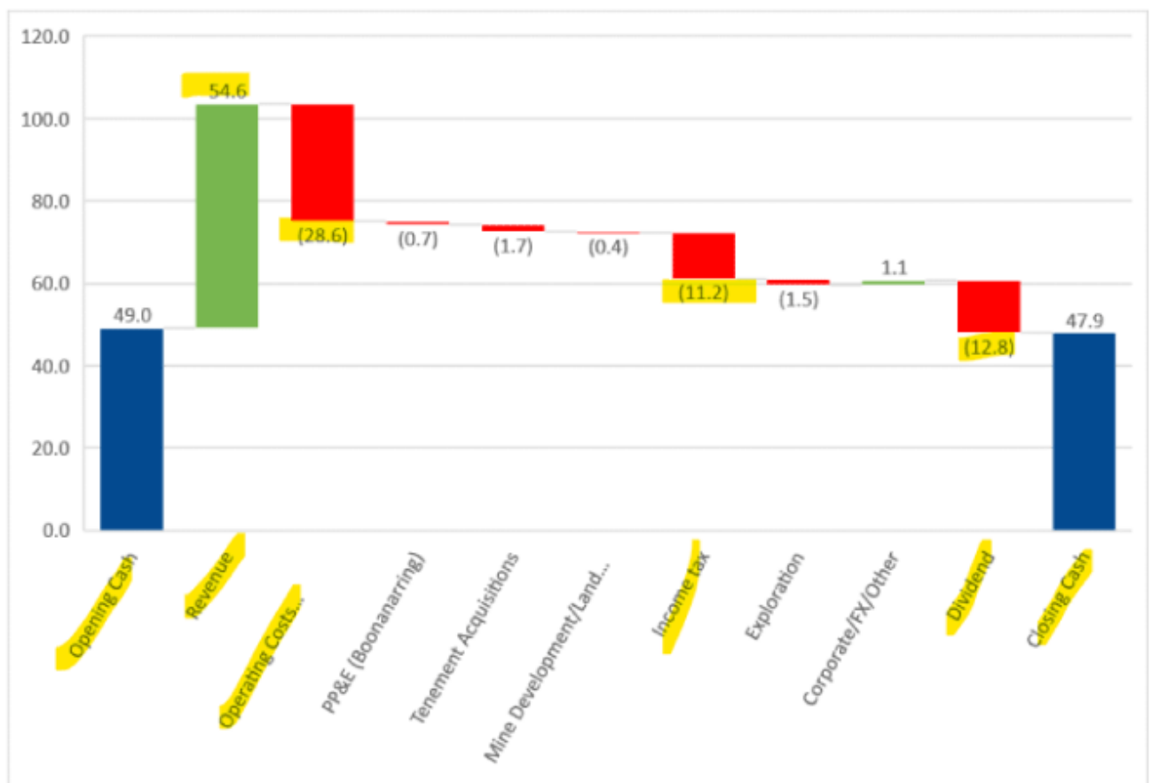
Image erzielte 54,6 Millionen AUD Umsatz und die operativen Kosten lagen bei 28,6 Millionen AUD. Die Steuer für den Gewinn des letzten Jahres wurde bezahlt (11,2 Mio. AUD) und die Dividende vom April schlug mit 12,8 Millionen AUD zu buche. Ende Juni lag die Cash-Position bei 47,9 Millionen AUD, nach 49 Millionen Anfang des Quartals:

Das Unternehmen hat die Prognose um rund 10% gesenkt, um den steigenden Kosten Rechnung zu tragen