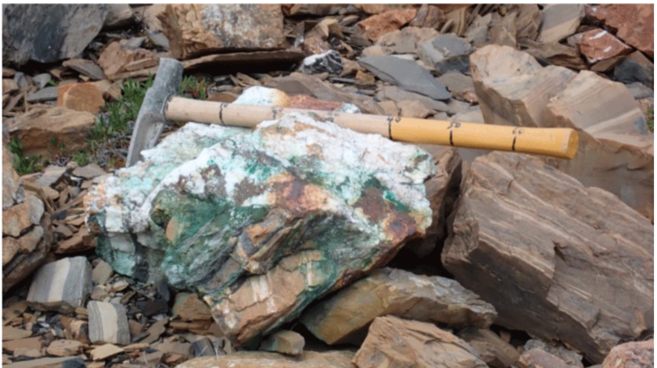
Float Sample D – 723205; 0.36% Cu, 1,581 meters vertically

Die Splitterprobe D - 723206 wurde auf einer Höhe von 1.594 Metern entnommen und bestand zu 65% aus