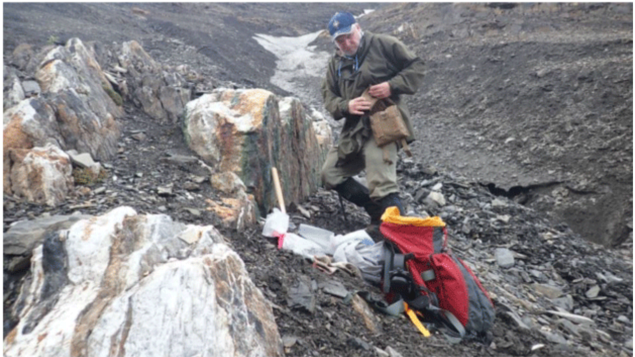
Grab Sample D – 723238; 1.85% Cu, 1,657 meters vertically

Die Float-Probe D - 723237 bestand aus stark geschertem grauem Schiefer/Schluffstein mit zahlreichen Quarzkarbonatsträngen und auch Bruchfüllung, mäßiger Malachit-Kupfer-Alteration, einer Spur Azurit und Bornit sowie 2% Chalkopyrit in Form von Blasen und Einsprengseln. Es wurden keine Höhenmessungen vorgenommen. Diese Probe ergab 0,95% Kupfer. Siehe Tabelle I oben und Foto 7 unten.