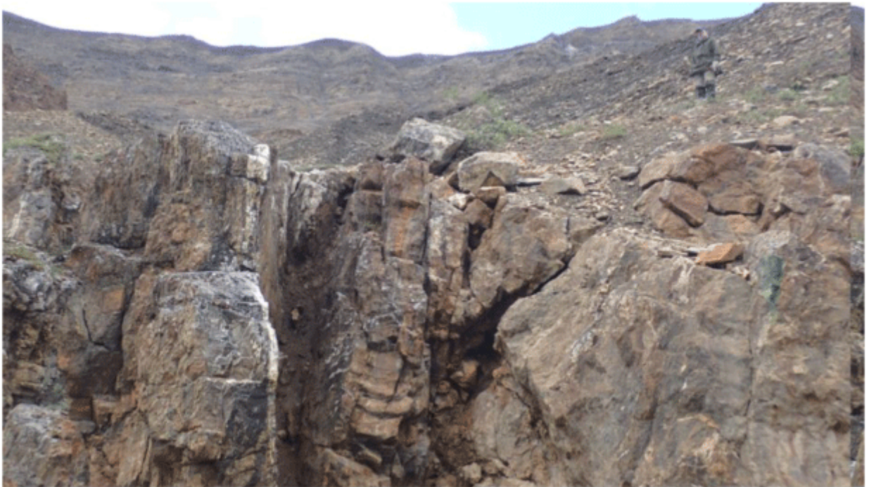
Grab Sample D – 723241; 0.01 % Cu, 1,574 meters vertically

Die Float-Probe D - 723205 wurde 7 Meter senkrecht über der Grabprobe D - 7233241 entnommen und bestand aus Quarzkarbonat, das eine rotbraune Farbe mit gelbbraunen Flecken und Auflösungshohlräumen auf der verwitterten Oberfläche aufwies. Es waren kleinere Löcher vorhanden und reichlich Malachit mit einer Spur von Azurit und weniger als 1% Chalkopyrit als Flecken, die eine Spur von Bornit enthielten. Diese Probe ergab einen Kupfergehalt von 0,36%. Siehe Tabelle 1 und Foto 2 unten.