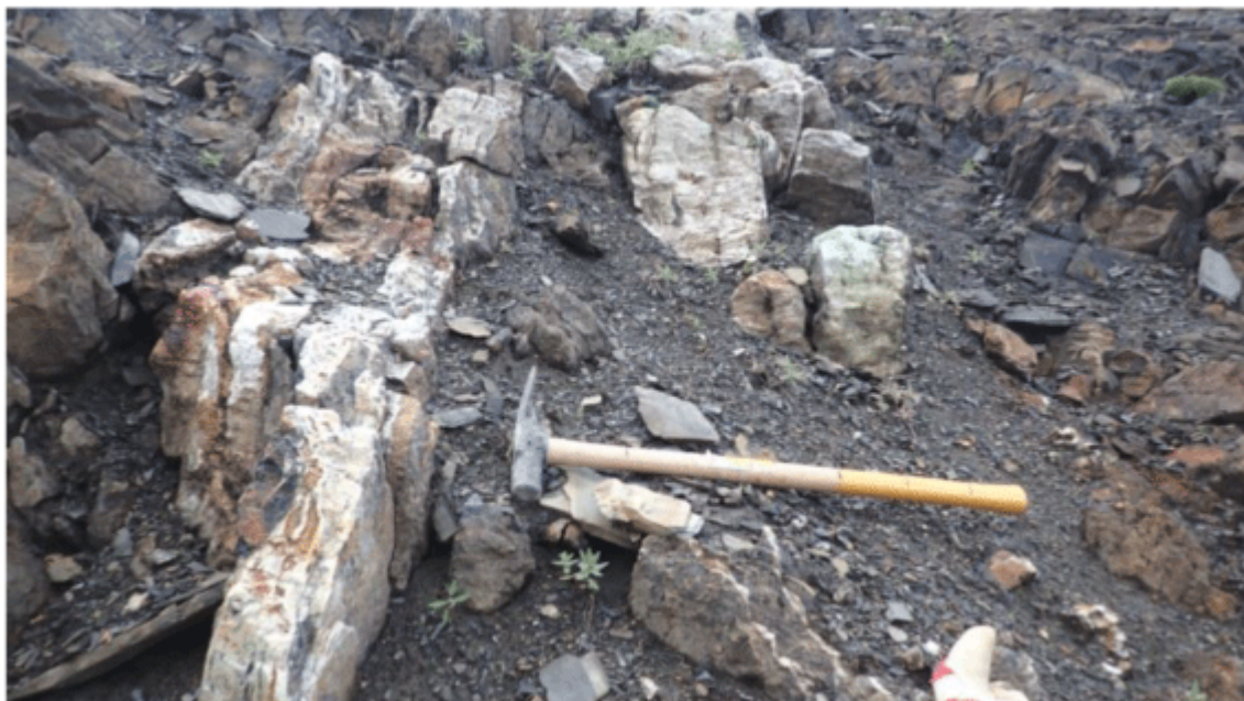
Float Sample D – 723240; 0.86% Cu, 1,603 meters vertically