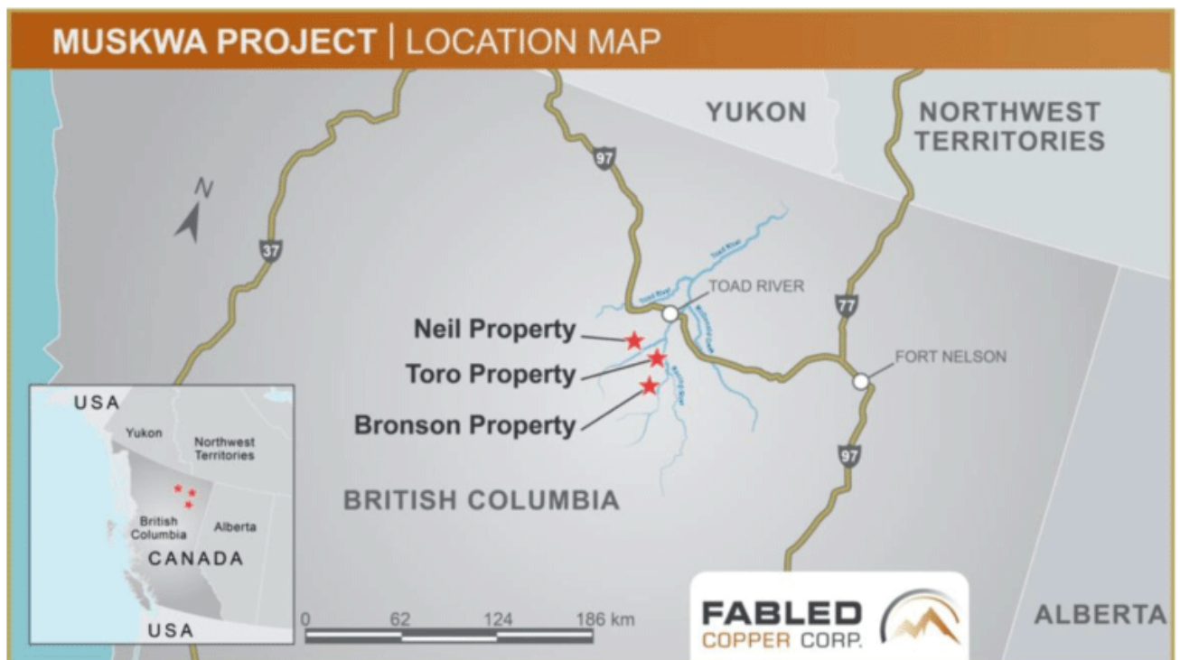
Abbildung 1 – Lageplan

"Wir haben bereits über unsere Ergebnisse bei der Lady Luck Sichtung am südlichen Ende des Neil Projekts berichtet, gefolgt von der Mac Sichtung, der 8A Kupfersichtung, der Harris Kupfersichtung und der 2a Kupfersichtung im zentralen Teil des Neil Projekts. Wir bewegen uns nun zur 2b Kupfersichtung, die sich etwa 2 Kilometer südwestlich der 2a Sichtung befindet und möglicherweise die Fortsetzung davon ist.