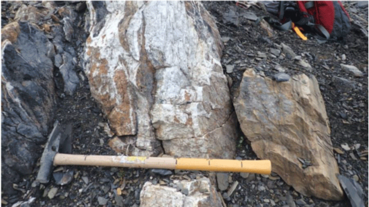
Chip Sample D – 723206; 0.01% Cu over 1.0 meters, 1,594 meters vertically

Die Float-Probe D - 723240 bei 1.603 Höhenmetern bestand aus weißem Quarz mit Karbonat und 5% gescherterem Schluffstein, mit reichlich Malachit-Kupfer-Alteration und weniger als 1% Chalkopyrit in Form von Flecken und Blasen. Diese Probe ergab 0,86% Kupfer. Siehe Tabelle 1 und Foto 4 unten.