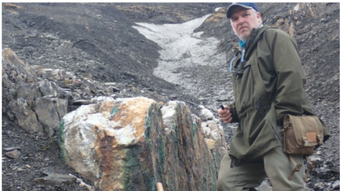
Float Sample D – 723237; 0.95% Cu