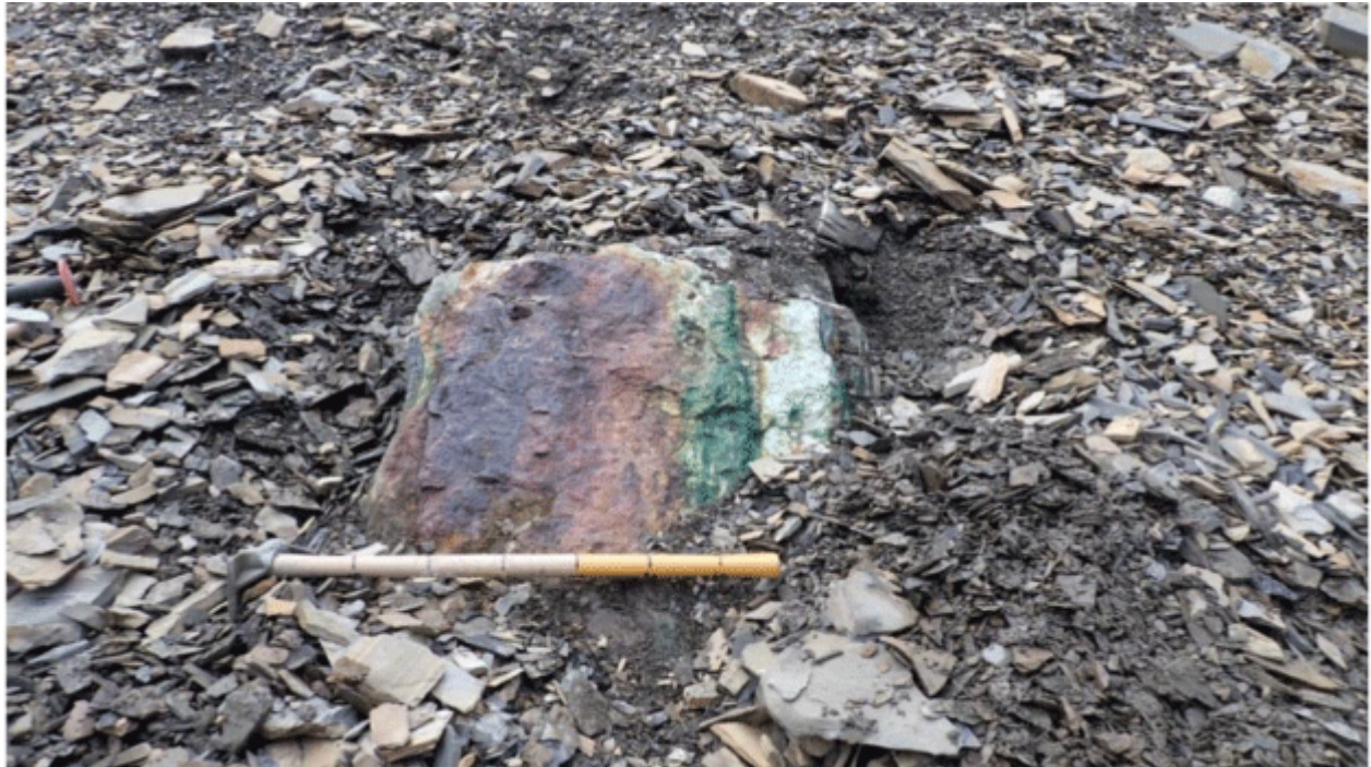
Float Sample D – 723239; 4.66% Cu, 1,615 meters vertically