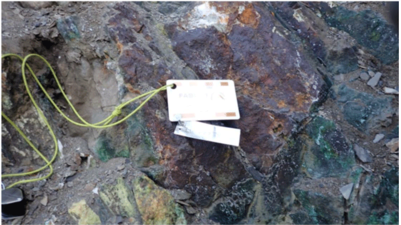
Grab Sample # D – 723420, elevation 1,401 m, 1.81% Copper

Die Grabprobe D - 723418 wurde 1 Meter senkrecht über der oben beschriebenen Probe entnommen und bestand aus Quarzkarbonat mit Löchern, Flecken von Limonit mit einer geringfügigen Malachit-Kupfer-Alteration, mit 10% Chalkopyrit als Flecken und mit Blasen und Einsprengeln. Diese Probe ergab einen Kupfergehalt von 4,83%. Siehe Tabelle 1 und Foto 2 unten