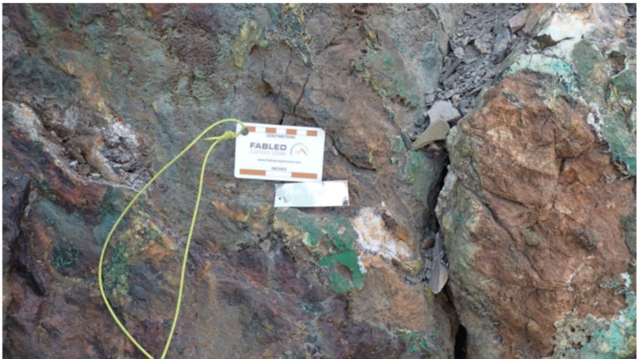
Chip Sample # D – 723424, elevation 1,457 m, 1.56% Copper over 0.50 meters