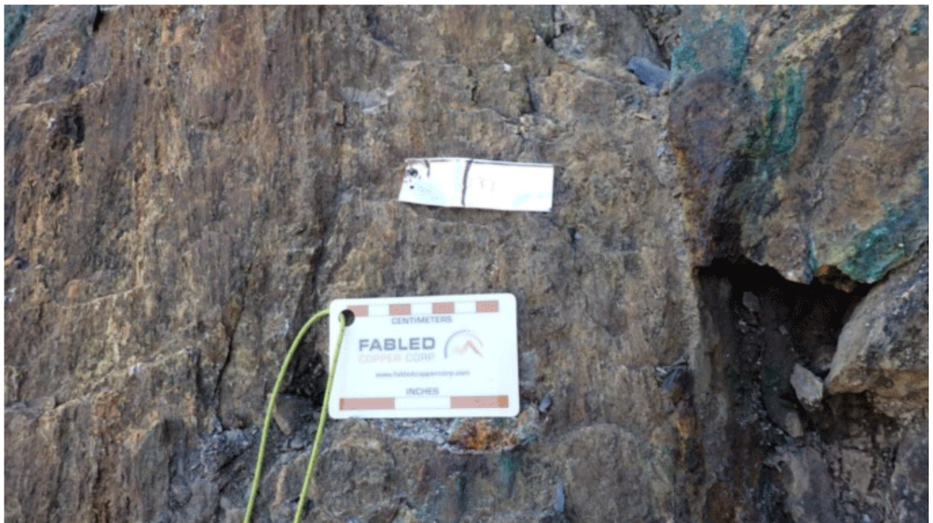
Grab Sample # D – 723418, elevation 1,402 m, 4.83% Copper