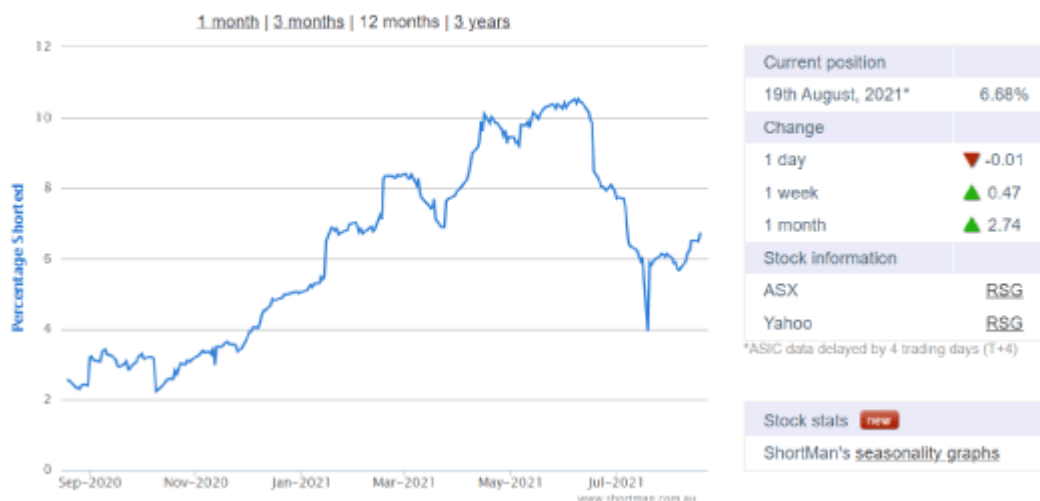
RESOLUTE MINING ORDINARY (RSG)

Da ich mit der Cash-Spritze aus dem Verkauf von Bibiani und dem laufenden Cash-Flow keine finanziellen Schwierigkeiten der Firma auf die nächsten 12 Monate sehe, reizt mich das absurd niedrige Kursniveau schon sehr.