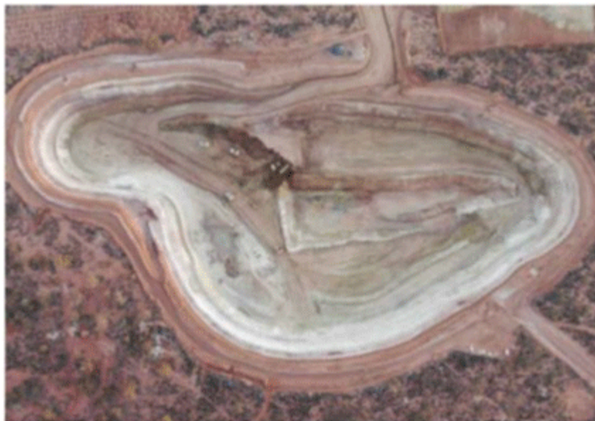
Figure 4: Geko Pit as at end June 2020

Dem Bild nach zu urteilen, hat Habrok dort ganz schön "Musik" gemacht: