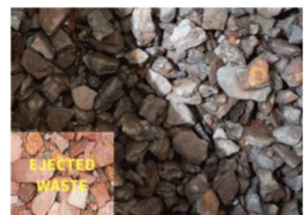
Figure 3: Ore sorting removes additional waste to improve concentrate grade to 33% Mn.