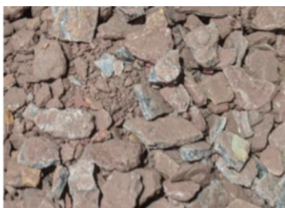
Figure 1: Bulk manganese ore post crushing.

Wie ich aus unternehmensnahen Kreisen erfahren habe, soll es nun endlich soweit sein, dass diese Studie zeitnah veröffentlicht wird. Dies könnte dann zu einer entsprechenden Aufmerksamkeit führen, wenn die Zahlen gut aussehen.