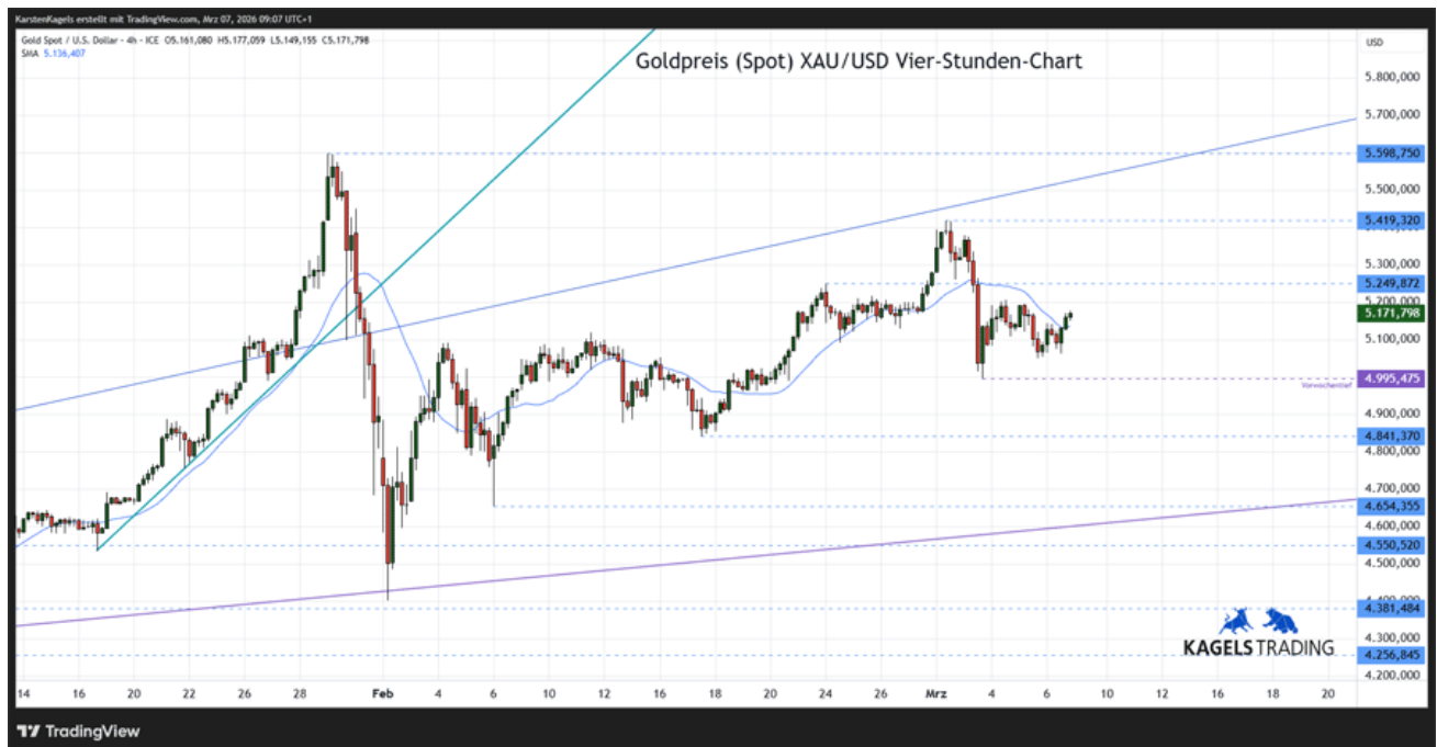
Goldpreis Prognose: Kurs im Stundenchart

&#149; Wichtige Unterstützungen: 4.995 $ | 4.841 $