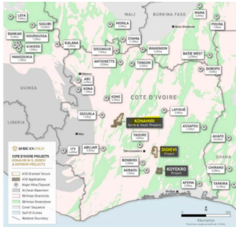
Figure 4: Côte d'Ivoire map showing greenstone belts, major gold projects, and African Gold's tenements

Das Konahiri Gebiet liegt nordwestlich von Didievi: