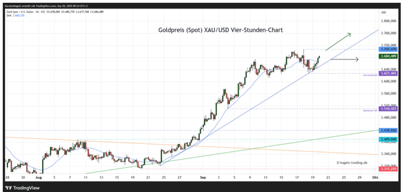
Goldpreis Prognose: Kurs im Stundenchart

&#149; Wichtige Unterstützungen: 3.627 $ | 3.510 $ | 3.438 $