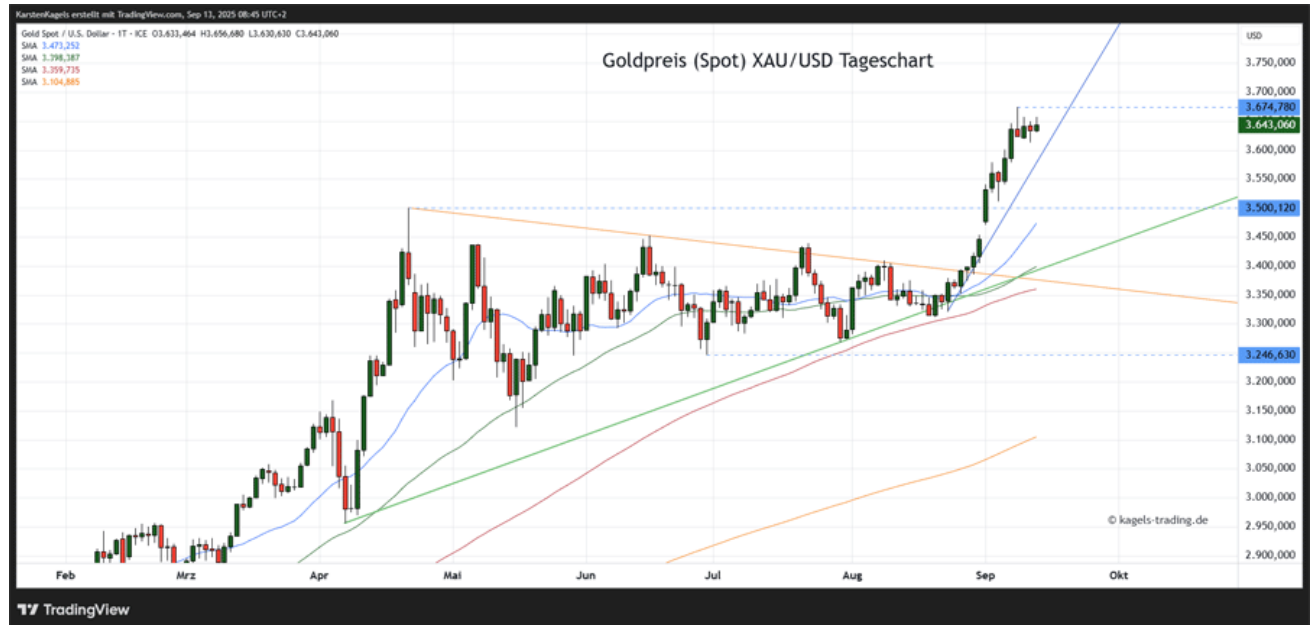
Goldpreis Prognose Tageschart - diese & nächste Woche

➤ Mögliche Wochenspanne: 3.590 $ bis 3.710 $