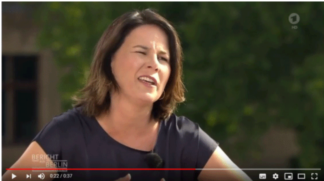
Annalena Baerbock, Bündnis90 Die Grünen und ihr Kobold! :-)

Auch unserer Grünen beschäftigen sich ja intensiv mit Elektrofahrzeugen und den darin unentbehrlichen Batterien. Annalena Baerbock hat zuletzt im ARD Sommerinterview klargestellt, dass Sie dafür ist, keine Koblode mehr in die Batterien zu verbauen: www.youtube.com