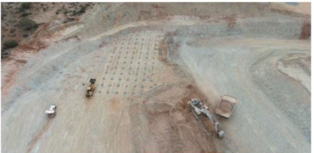
Plates 1 to 3 from top: view looking NW, Stage 1 West Lode mining, view of drill blast pattern (bottom)