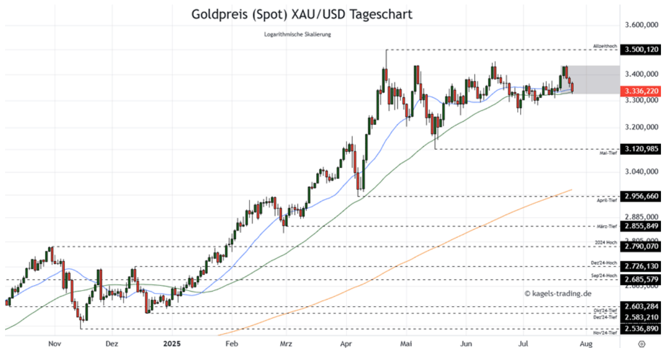
Goldpreis Prognose Tageschart - diese & nächste Woche

• Mögliche Wochenspanne: 3.160 $ bis 3.320 $ alternativ 3.360 $ bis 3.520 $