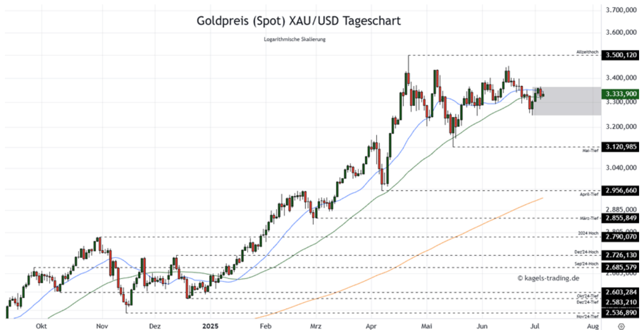
Goldpreis Prognose Tageschart - diese & nächste Woche (Chart: TradingView )

➤ Mögliche Wochenspanne: 3.390 $ bis 3.570 $ alternativ 3.090 $ bis 3.270 $