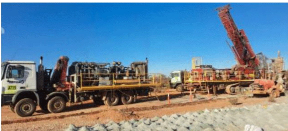
Figure 2 Rig Mobilised and drilling at the Icon Appollo trend