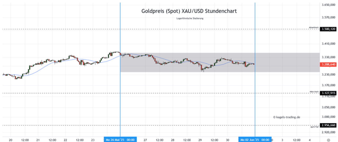
Goldpreis Prognose: Kurs im Stundenchart

Von seinem jüngsten Allzeithoch an der markanten 3.500er $-Marke hat der Goldpreis nach unten gedreht und in Richtung März-Hoch korrigiert. Darüber bildet sich zunächst eine Tradingrange, die auch in der vergangenen Woche um den 3.300er $-Bereich gependelt ist. Abhängig von möglichen Entwicklungen um die Zollpolitik der führenden Wirtschaftsnationen könnte sich zum Wochenstart am Montag noch Potenzial für stärkere Impulse in beide Richtungen bilden. Aus der technischen Betrachtung heraus wäre jedoch Druck auf das Vorwochentief zu erwarten.