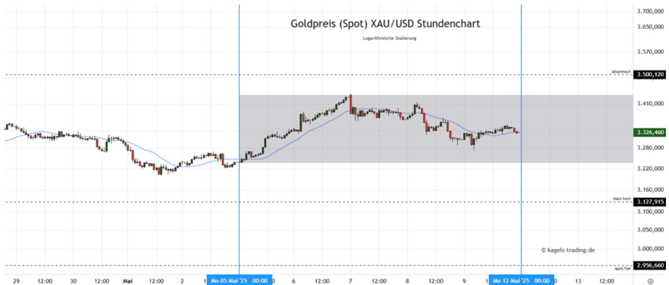
Goldpreis Prognose: Kurs im Stundenchart (Chart: TradingView )

Von seinem jüngsten Allzeithoch an der markanten 3.500er $-Marke hat der Goldpreis nach unten gedreht und sich über der 3.200er $-Marke stabilisiert. In vergangenen Woche konnte der Kurs zunächst ein Polster aufbauen, ist vom Hoch jedoch in eine Korrekturbewegung übergegangen. Am Ende wurde die 3.300er $-Marke gehalten und könnte zum Start in die neue Woche am Montag weiter stützen.