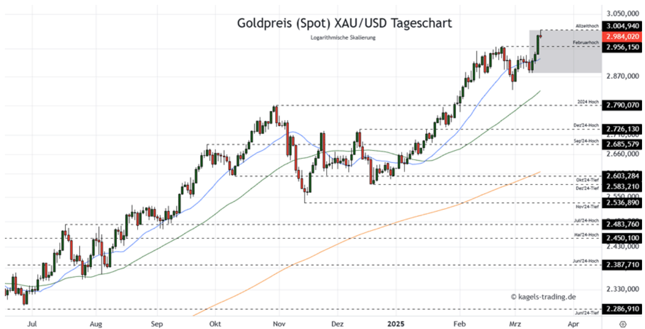
Goldpreis Prognose Tageschart - diese & nächste Woche

&#149; Mögliche Wochenspanne: 2.900 $ bis 3.030 $ alternativ 2.970 $ bis 3.110 $