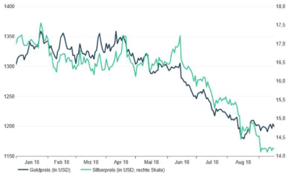
Chart der Woche: Gold und Silber im Gleichschritt nach unten!