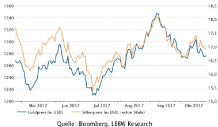
Chart der Woche: Gold und Silber (in USD) seit Anfang September im Gleichschritt nach unten.

Auch das politische Risiko (Stichwort: Nordkorea) scheint von den Anlegern momentan weniger kritisch gesehen zu werden, so dass der "sichere Hafen" Gold weniger gefragt ist. Dennoch: Die Realzinsen in den wichtigsten Währungsräumen sind unverändert niedrig. Dies lässt Gold und Co. weiterhin attraktiv erscheinen. Zudem lehren die letzten Monate, dass das politische Risiko auch wieder sehr schnell zurück auf die Agenda der Anleger kehren kann.