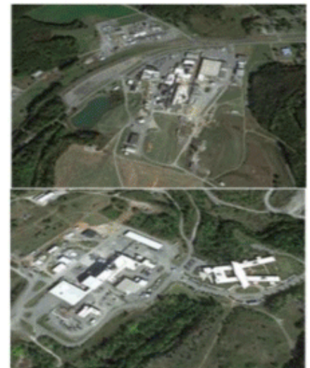
Piedmont Lithium Location and Bessemer City Lithium Processing Plant (FMC, Top Right) and Kings Mountain Lithium Processing Facility (Albemarle, Top Left)