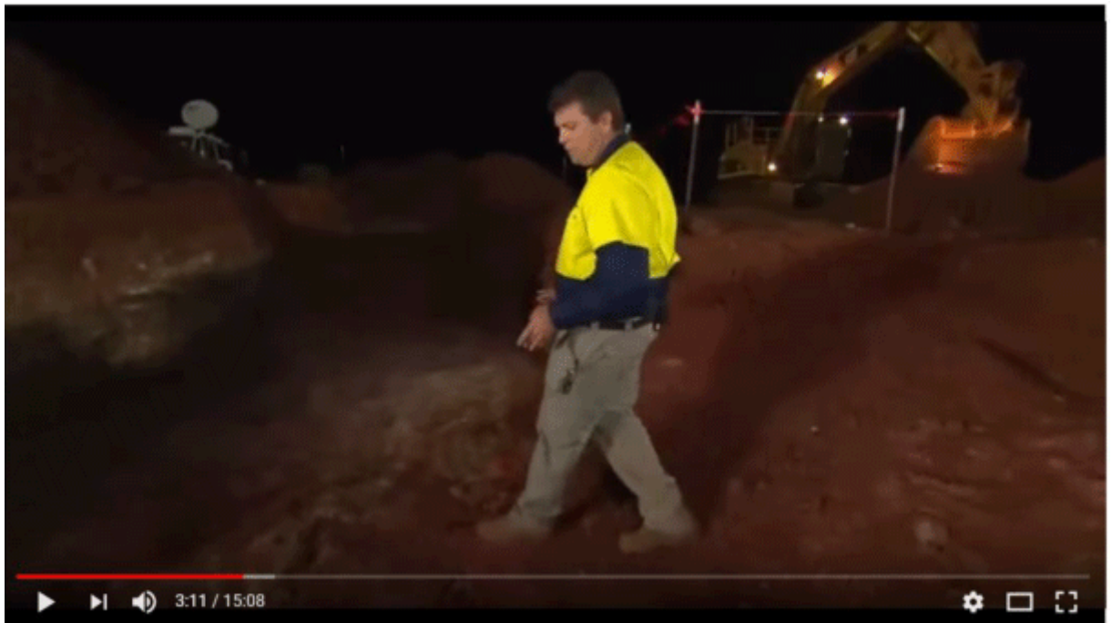
Novo Resources' live stream of gold exploration at Purdy's Reward - Denver Gold Forum - 26Sep2017

Novo selbst ist von ca. 0,80 CAD auf über 6 CAD gestiegen: