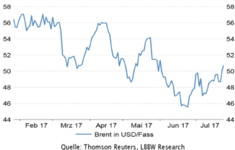
Chart der Woche: Brent (in USD) zum ersten Mal seit acht Wochen wieder über 50 USD.

© Dr. Frank Schallenberger Commodity Analyst