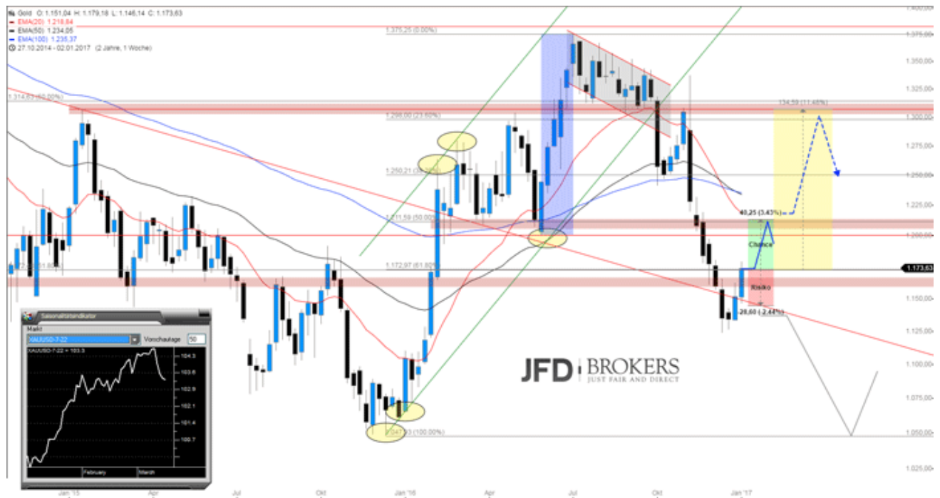
Weekly-Chart - Created Guidants

Vorsicht wäre andererseits bei Unterschreitung des aktuellen Wochentiefs bei 1.146 USD angebracht. In diesem Fall müsste man sich auf einen Test der Dezembertiefs sowie einem weiteren Abwärtslauf in Richtung des Tiefs vom Dezember 2015 einstellen. Warten wir ab was geschieht und vergessen Sie eines dabei NIE: Das einzige was sich an den Märkten kontrollieren lässt ist das Risiko und der richtige Broker in Sachen Ausführungsqualität und Transparenz! Es liegt in Ihrer Hand und Ihr Erfolg ist unser... Happy Trading!