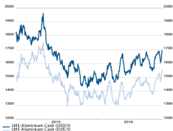
Aluminiumpreis seit 2015 in USD und EUR

Die International Copper Study Group (ICSG) hat ihre Prognosen bezüglich der Angebots- und Nachfrageentwicklungen auf dem Kupfermarkt aktualisiert. So geht das Institut nun für dieses und für das nächste Jahr von einem höheren Angebot an raffiniertem Kupfer aus als noch in der letzten Prognose vom April. Dies dürfte im Wesentlichen auf den starken Zuwachs an Kupferkonzentraten zurückzuführen sein. Das erwartete Wachstum der Minenförderung für das laufende Jahr wurde von 1,5% auf 4,0% angehoben.