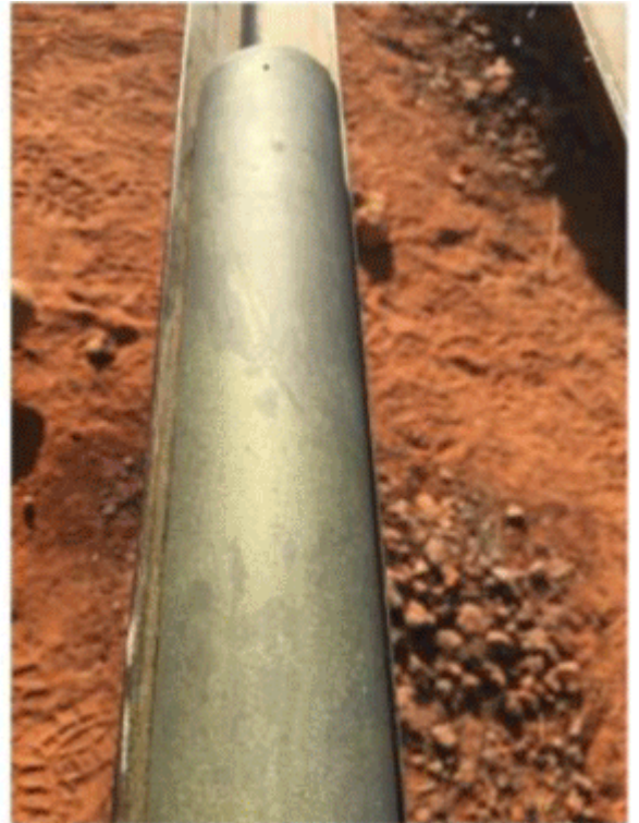
Massive sulphide mineralisation from hole TLDD0004A

Dies dürfte somit der nächste Erzkörper in der Region sein und das Erstaunliche ist, dass das Gebiet gerade einmal 10 Kilometer östlich von Doolgunna, der Sandfire-Entdeckung, liegt: