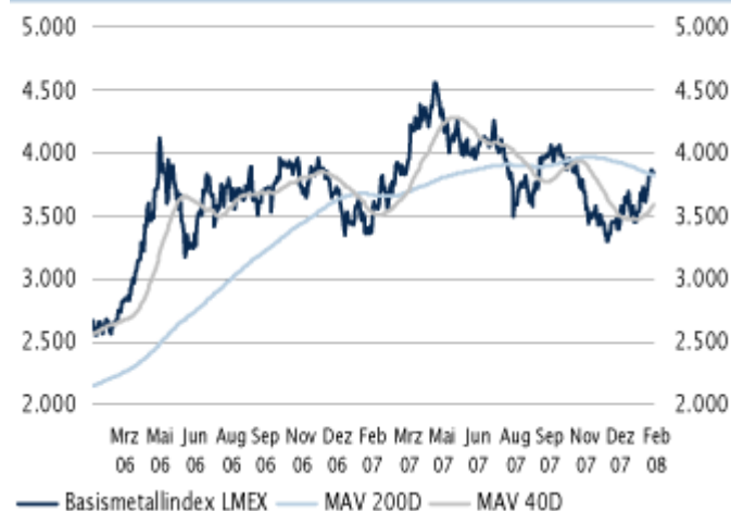
Basismetallindex LME und gleitende Durchschnitte: Basismetallpreise seit Ende 2007 wieder im Aufwärtstrend

In der abgelaufenen Handelswoche setzte sich die Rallye der Basismetallpreise weiter fort. Trotz verhaltenem Auftakt in Shanghai, wo am Mittwoch nach einwöchigen Feierlichkeiten der Handel wieder aufgenommen wurde, schlossen sämtliche in London gehandelten Metalle im Plus. Gemessen am Basismetallindex LME haben die Metallpreise damit bereits annähernd das Niveau erreicht wie vor Ausbruch der US-Subprimekrise. Angesichts des inzwischen merklich schlechteren makroökonomischen Umfelds erscheint dies zunächst paradox. Betrachtet man dagegen die Situation auf den einzelnen Teilmärkten, so ist ein Großteil der Preissteigerungen seit Jahresbeginn durchaus fundamental begründet. Nichtsdestotrotz zeigen einige Metalle, wie etwa Kupfer, Blei und Aluminium, mittlerweile kurzfristig Überhitzungsanzeichen auf, so dass eine temporäre Gegenbewegung immer wahrscheinlicher wird.