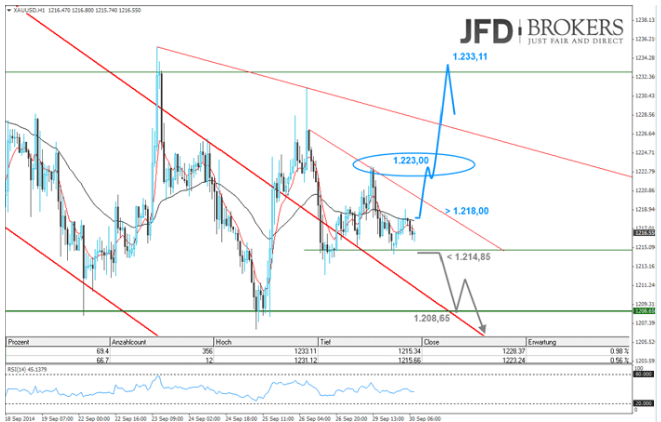
H1 Chart - Created Using MT4-JFD-Brokers & Forex-Bull

© Christian Kämmerer Head of Research & Analysis JFD Brokers Germany JFD Brokers - Just FAIR and DIRECT www.jfdbrokers.com