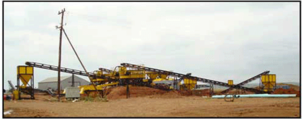
Installation of new pan plant facilities at the Tirisano mine site

Etruscan Resources Inc. hält 53,7% Anteile an Etruscan Diamonds, Mountain Lake Resources Inc. (TSXV: MOA) hält 16,2% der Anteile und andere dritte Parteien halten 30,1% der Anteile. Etruscan Diamonds hält einen 74%igen Anteil am Blue Gum Projekt, die verbleibenden 26% werden von Etruscan Diamonds schwarzem Beteiligungspartner, der Mogopa Minerals (Pty) Ltd. gehalten.