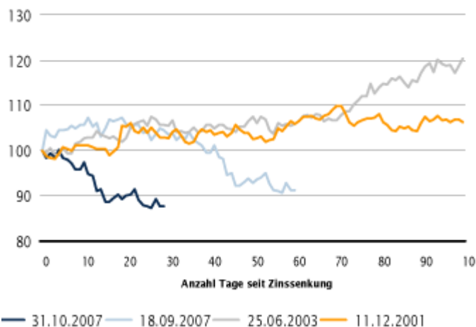
Entwicklung des GSCI Industrial Metals Index im Anschluss an die letzten vier US-Zinssenkungen

Verlierer der Woche war abermals Blei, das einen Preisrückgang von 7% verzeichnete. Aber auch Kupfer (-5%), Zink (-4%) und Nickel (-3%) schlossen allesamt deutlich im Minus. Angesichts sinkender Liquidität zum Jahresende hin sind größere Preisbewegungen in den verbleibenden Handelstagen nicht auszuschließen. Eine erhöhte Volatilität ist auch in der zweiten Januarwoche zu erwarten, da hier die Gewichte des Dow Jones AIG Commodity Index neu adjustiert werden. Die Neugewichtung könnte je nach Berechnung Terminkäufe von bis zu 250.000 t Zink und 10.000 t Nickel nach sich ziehen.