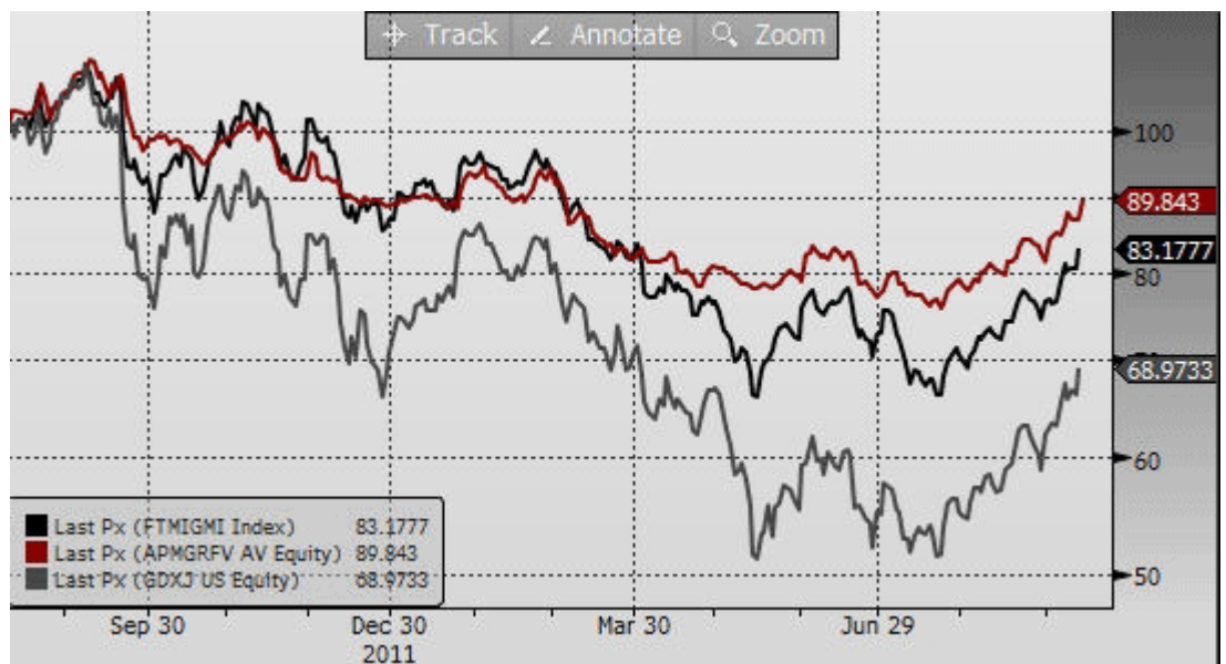
APM Gold & Resources Fund EUR (rot) FTSE Gold Mines Index USD (schwarz) MV Junior Gold Miners (grau)