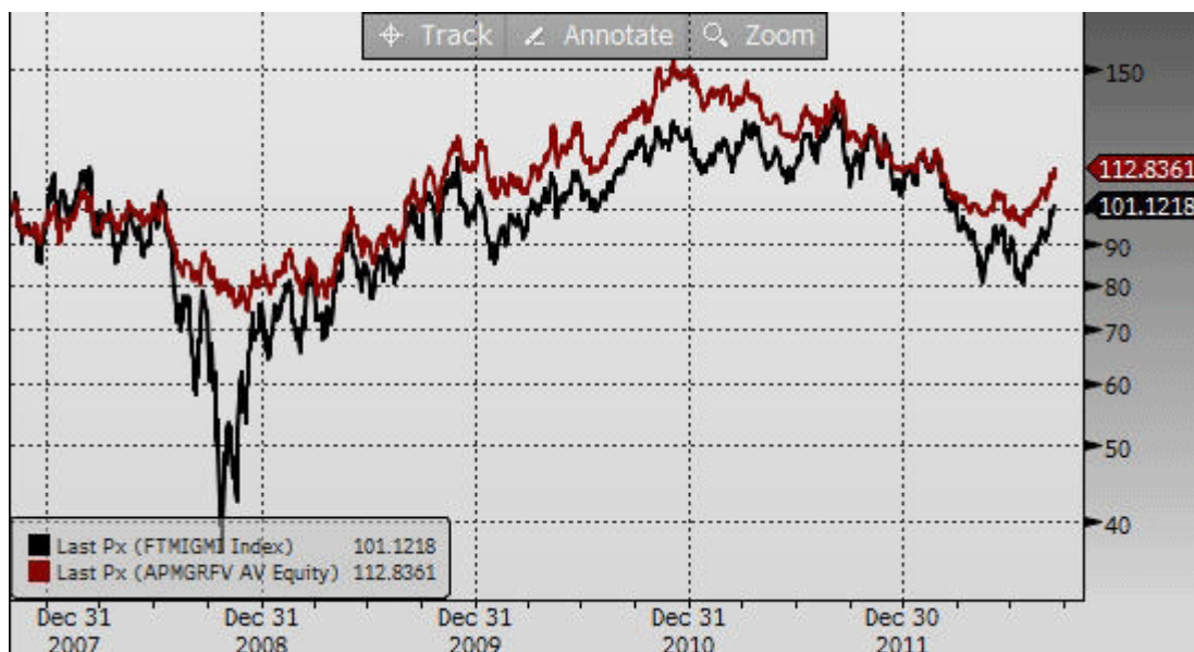
APM Gold & Resources Fund (rot) FTSE Gold Mines Index (schwarz)