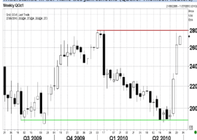
Der Hafer Future (CBOT weekly) springt per limit-up an die Widerstände in der Nähe des Jahreshochs

Auf dem Getreidesektor werden auch die Auswirkungen der chinesischen Ankündigung zur Lockerung der Währungspolitik diskutiert, aber viele messen der Wetterentwicklung in den kommenden Wochen eine höhere Bedeutung bei. Die Kursgewinne der Futures halten sich mit ca. 1,5% im Vergleich zum Freitag bisher in überschaubaren Grenzen und auch der November-Future für Sojabohnen - einem wichtigen Importgut Chinas - macht bisher keine Ausnahme.