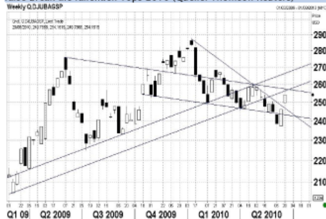
Der DJ UBS Subindex Agrar (weekly spot) überwindet nach klassischem false break die fallenden Tops 2010

Auf dem Getreidesektor werden auch die Auswirkungen der chinesischen Ankündigung zur Lockerung der Währungspolitik diskutiert, aber viele messen der Wetterentwicklung in den kommenden Wochen eine höhere Bedeutung bei. Die Kursgewinne der Futures halten sich mit ca. 1,5% im Vergleich zum Freitag bisher in überschaubaren Grenzen und auch der November-Future für Sojabohnen - einem wichtigen Importgut Chinas - macht bisher keine Ausnahme.